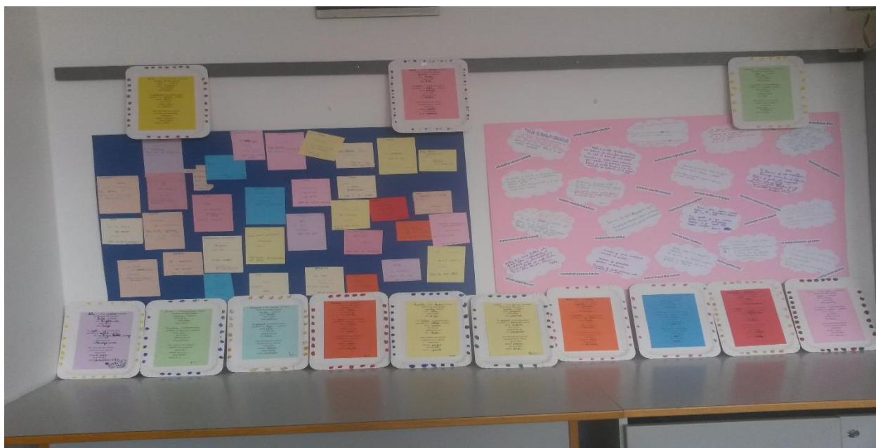
Slika 3Razstavljeni izdelki

Nastale izdelke smo razstavili v učilnici: