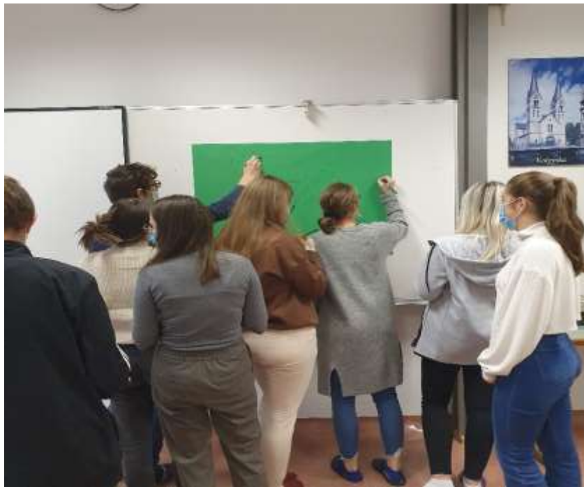
Slika 2: Dijaki pišejo na tabelski list

Nato smo se posladkali ob magdalenicah in zeliščnem čaju. Tako smo obudili svoje čute, vonje, toploto, ugodje, ki nam ga lahko vzbudijo hrana, pijača, vonj, toplota. Ob tem smo se pogovarjali o prijetnih spominih na otroštvo. Dijaki so se spomnili na počitnice s starši, morske dogodivščine, otroške športne aktivnosti, prosti čas, ki so ga preživljali s prijatelji, na dogodke iz vrtca in seveda sladkarije, s katerimi so jih razvajala babice.