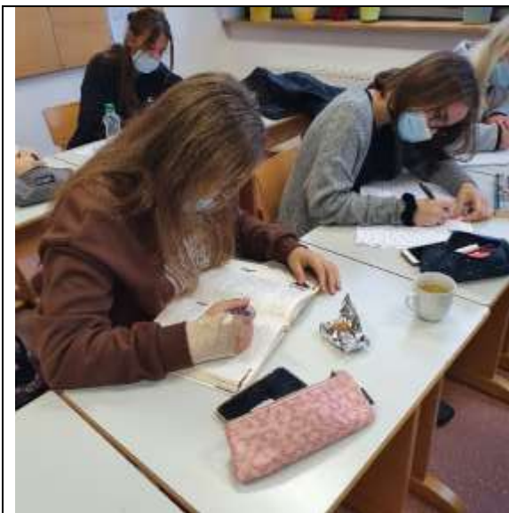
Slika 6: Dijaki ponovno berejo odlomek