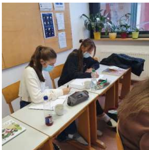
Slika 8: Dejavnost po branju

Ura slovenščine je minila v prijetnem vzdušju. V projektu OBJEM je eden od naših ciljev spodbuditi dijake k aktivnostim med poukom. Predvsem z raznolikimi in kratkotrajnimi strategijami lahko vzbudimo pri dijakih učinkovito motivacijo za branje in učenje.