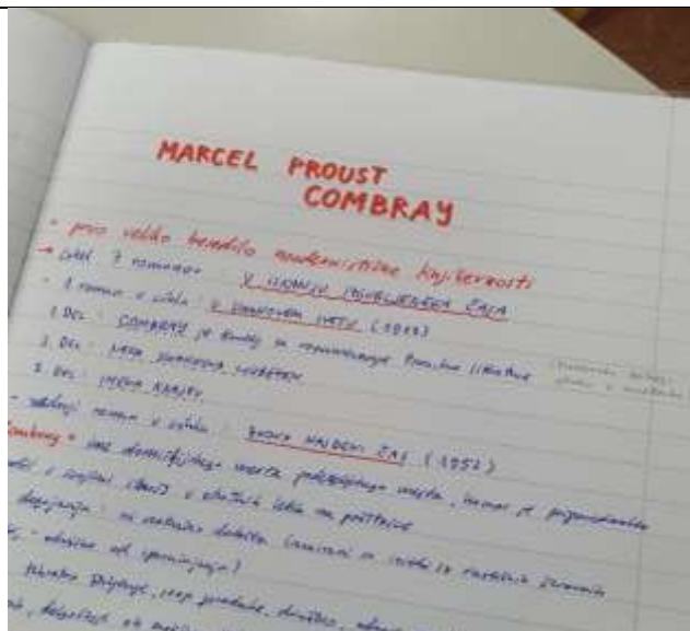
Slika 7: Zapis v zvezek - Ema Lavrič