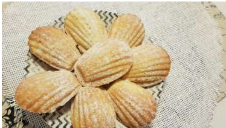
Slika 4: Magdalenice

Ker vsi niso poznali magdalenic, so dijakinje na spletu poiskale slike, kako izgledajo in recept, če bi same doma znale narediti to slastno pecivo. Če smo vam ob prebiranju in gledanju slik vzbudili radovednost, prilagamo recept na povezavi: https://oblizniprste.si/slaskne-sladice/sladke-magdalenice/