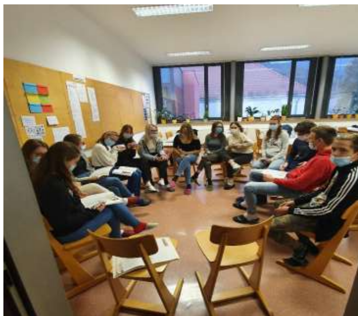
Slika 5: Branje v prijetnem vzdušju

Za branje odlomka smo si preuredili učilnico in se posedli v krog. Vsak dijak si je vzel skodelico čaja in magdalenico, tipično francosko pecivo, o katerem piše tudi znameniti francoski pisatelj Marcel Proust. V tako prijetnem vzdušju smo začeli z branjem odlomka iz romana Combray.