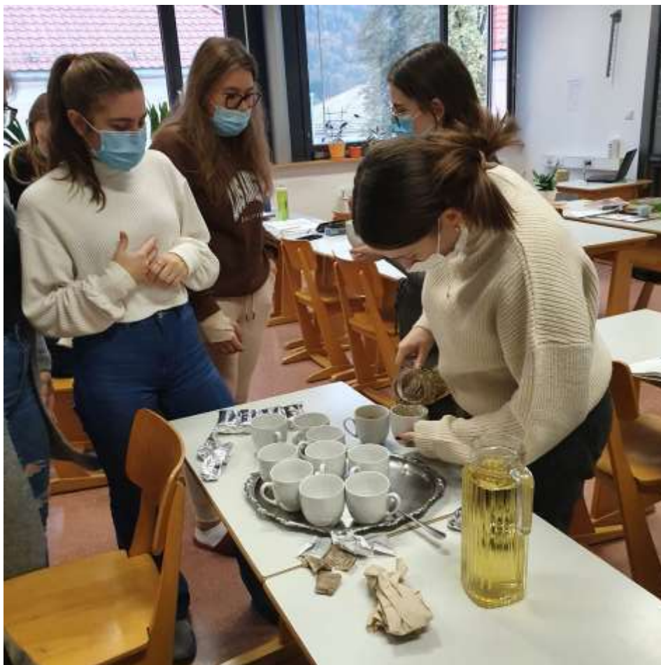
Slika 3: Priprava čaja

Nato smo si pripravili čaj in magdalenice.