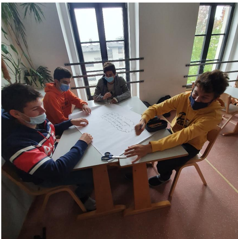
Slika 2Skupinsko delo