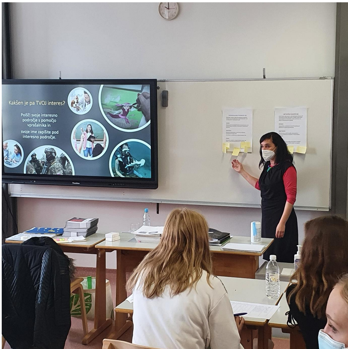
Slika 4 Razvijanje dijakove sporazumevalne zmožnosti